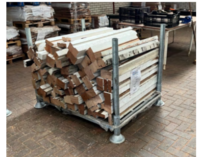
Voorbeeld kozijnhout in bok