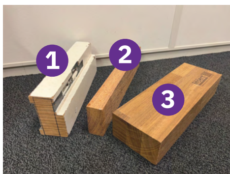
Tussen- en eindproduct proces

Kom je er niet uit? Stuur een mail naar hardhout@cooperatieinsert.nl